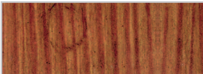
Ápoló balzsammal kezelve: károsodásmentes felület